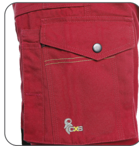
multifunkční kapsy na boku multifunctional side pockets boczne kieszenie wielofunkcyjne