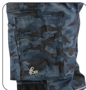
multifunkční kapsy na boku multifunkčné vrecká na boku multifunctional side pockets boczne kieszenie wielofunkcyjne