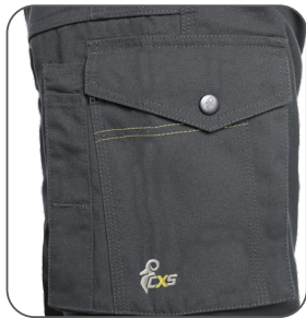
multifunkční kapsy na boku multifunkčné vrecká na boku multifunctional side pockets boczne kieszenie wielofunkcyjne