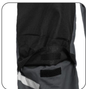
kolena s možností vložení výstuh kolena s možnosťou vloženia kolenných výstuh knees with possibility to insert pads kolana z możliwością włożenia nakolanników