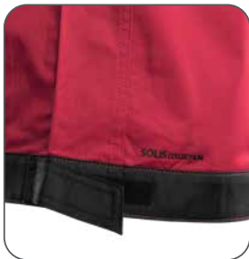
regulace v pase regulácia v pase adjustable waist regulowany pas