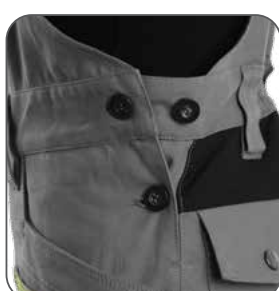
boční zapínání na knoflíky bočné zapínanie na gombíky side button fastening boczne zapięcie na guziki