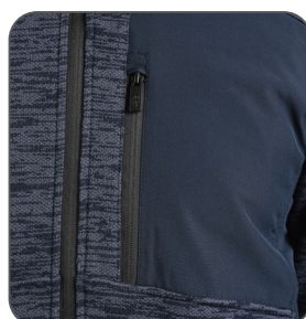
náprsní kapsa náprsné vrecko chest pocket kieszeń na piersi