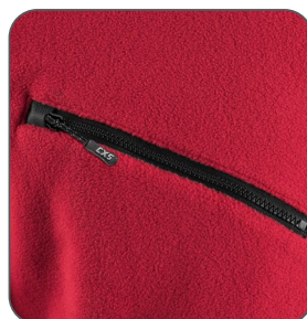
náprsní kapsa náprsné vrecko chest pocket kieszeń na piersi