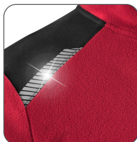
reflexní doplňky reflexné doplnky reflective accessories elementy odbłaskowe