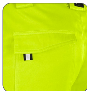
zadní kapsa zadné vrecko back pocket tylna kieszeń