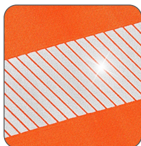
segmentované reflexní pásky segmentované reflexné pásky segmented reflective tapes segmentowe taśmy odbłaskowe