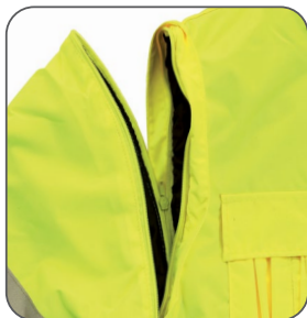
odepínací rukávy odnímateľné rukávy detachable sleeves odpinane rękawy