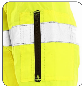
kapsa na rukávu vrecko na rukáve pocket on the sleeve kieszeń na rękawie