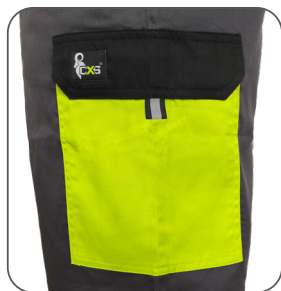
boční kapsa s klopou side flap pocket kieszeń boczna z patką