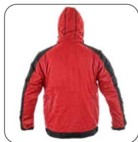
zadní strana zadná strana back side z tyłu