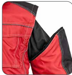
odepínací rukávy odnímateľné rukávy detachable sleeves odpinane rękawy