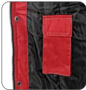
vnitřní kapsa vnútorné vrecko inner pocket kieszeń wewnętrzna